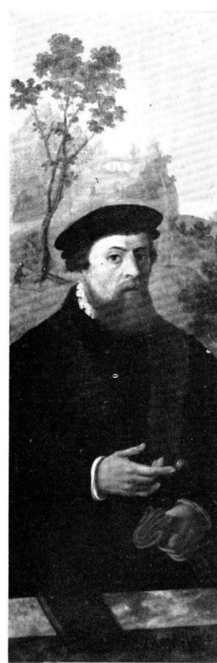
AFB. 2. SYBRANDT OCCO. SCHILDERIJ IN DE S. NICOLAASKERK TE CALCAR. (FRAGMENT).

„Das Bildniss eines Mannes mit einer Schriftrolle (No. 677), das früher den Namen Jan Mostaert trug, wurde abgedeckt und von seinen störenden Anstückungen befreit. Ein Werk von einer gewissen herben Kraft und strengen Farbigkeit. Es wurde jetzt „Niederdeutsch” bezeichnet, offenbar in Anschluss an die alte Bestimmung „Aldegrever” des Inventars Leopold Wilhelm. Die ausdrucksvoll knochigen Hände, die ornamentale Faltung des Karminsamtes der Aermel, die scharf akzentuierende Modellierung des Gesichtes, die gespitzten Lippen erweisen, dass es sich um ein Werk des Marinus van Roymerswaele handelt”.