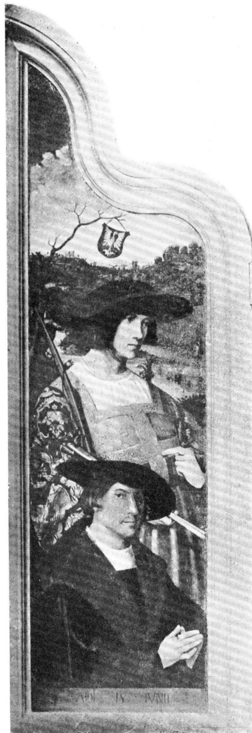
AFB. 4. JEUGDPORTRRET VAN POMPEJUS OCCO DOOR ? MUSEUM TE ANTWERPEN.