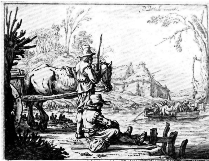
AFB. 2. P. BODDINK, PENTEKENING GEWASSCHEN IN BISTER. AMSTERDAM, COLL. DR. A. WELCKER.

sinds lang mijn nieuwsgierigheid geprikkeld door een uitstekende, voluit gesigneerde, teekening van P. Boddink 1) , en ik kon de gedachte niet van mij afzetten, dat daar meer achter schuilen moest. In deze teekening toch manifesteerde zich een zeker niet alledaagsch talent van een vroeg 17den eeuwschen Hollandschen kunstenaar. Toch is deze naam in onze kunstgeschiedenis tot heden een volslagen onbekende en in geen der „Schouburghen” of Kunstenaarslexica zal men zijn naam aantreffen (Afb. 2).