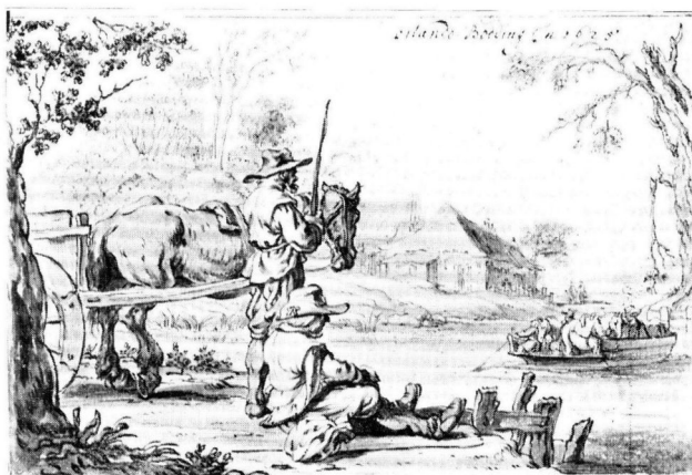
AFB. 3. O. BODDING. COPIE NAAR TEEKENING P. BODDINK. HAARLEM, MUSEUM TEYLER.

Museum Teyler te Haarlem van een veel minder geslaagde teekening met vrijwel geheel dezelfde voorstelling, mede voluit gesigneerd en gedateerd: „Orlando Boddink in 1625”, welke teekening niet anders beschouwd kan worden dan te zijn een copie naar de bovengenoemde van P. Boddink, met enkele wijzigingen in het oorspronkelijke 1) (Afb. 3). Hier kon geen andere conclusie getrokken worden, dan dat een familielid van onzen P. Boddink in 1625, zij het minder begaafd