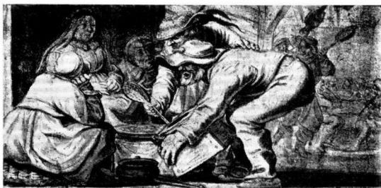
AFB. 6. P. COUWENHORN. BOERENBRUILOFT. AMSTERDAM, RIJKSPRENTENKABINET.

meer curieuze dan fraaie tekening in grisaille in het album amicorum van niemand minder dan Petrus Scriverius 9) met de voorstelling van de van haar troon opgerezen Minerva, die in een boek schrijft, terwijl Mercurius toeziet. Links een zuil op een globe en vele boeken op de grond. Ook hier nog de verzakkende trede op de voorgrond.