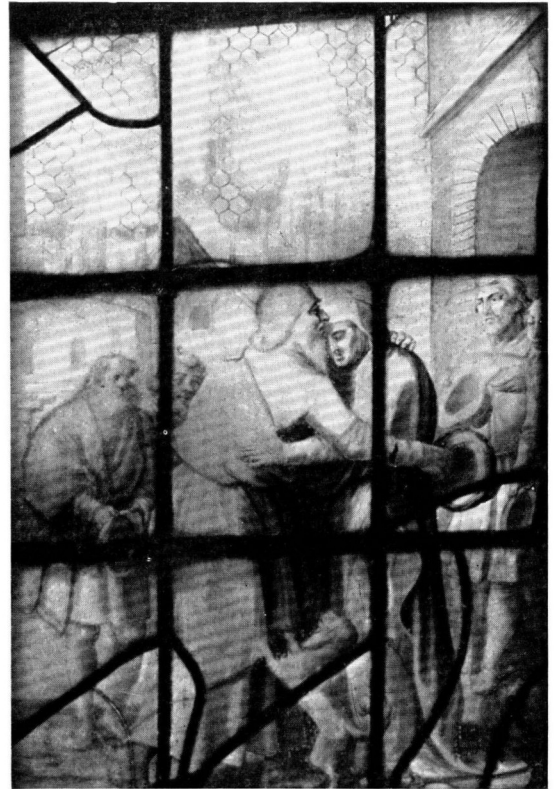
AFB. 3. P. COUWENHORN. DE ONTMOETING VAN JOACHIM EN ANNA AAN DE GOUDEN POORT.