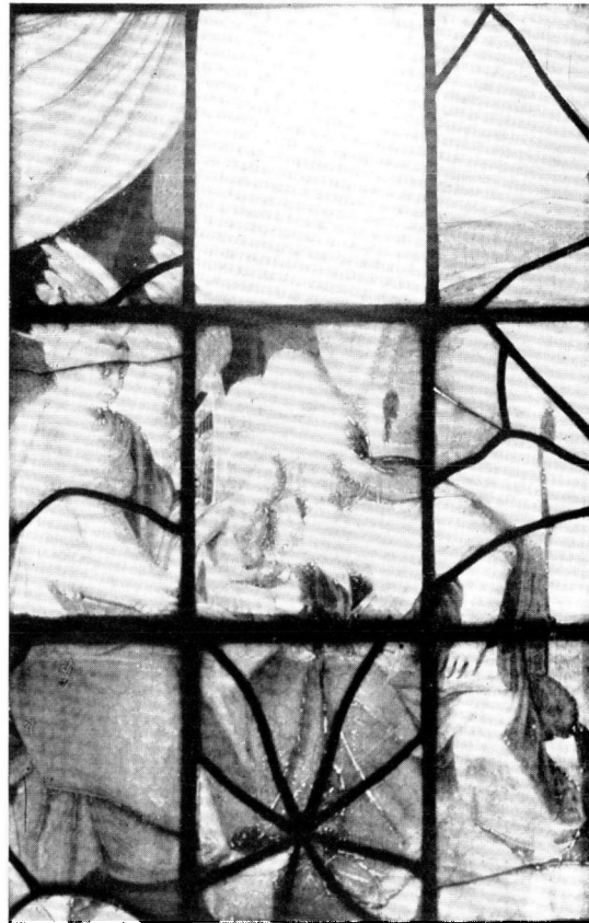
AFB. 5. P. COUWENHORN. ANNA TE DRIEËN.