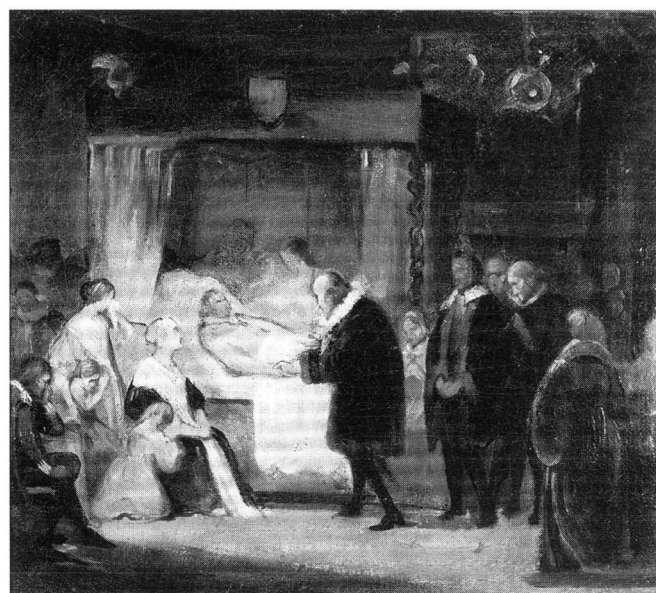
2 A. H. Bakker Korff, The Deathbed of Frederick Henry , Stedelijk Museum De Lakenhal, Leiden. Photo of the museum