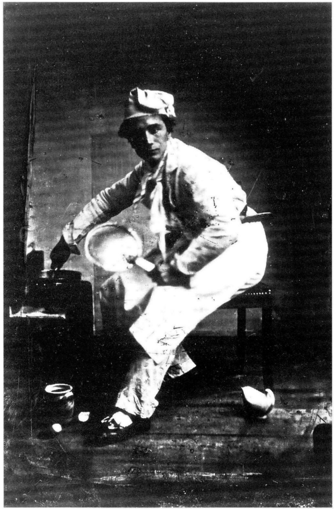
5 Unknown photographer, A Cook , Collection J. W. M. la Rivière, Nootdorp

The title is ostensibly that of a history painting, but when we come to look at it, it seems more like a parody than a depiction of a historical event (fig. 3). 4 The painting, which is owned by the Mauritshuis in The Hague but was loaned to the Lakenhal Museum in Leiden in 1923, is in fact a send-up of romantic history painting, which when the picture was painted in 1875 was still ‘en vogue’ in Holland, at that time something of an artistic backwater.