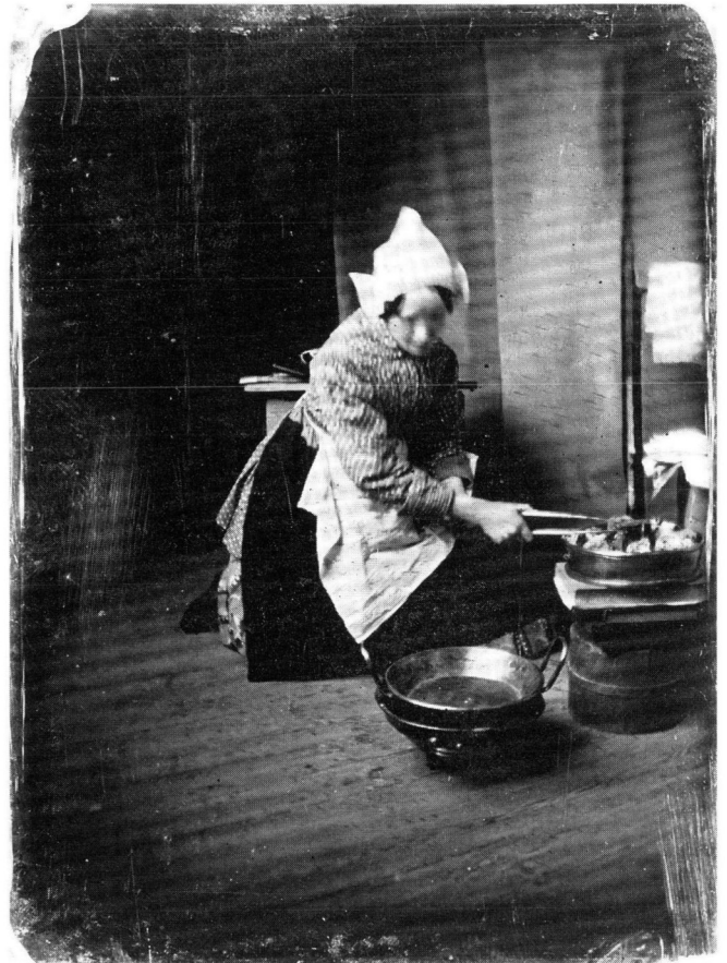
7 Unknown photographer, The Tart-baker , Collection J.W. M. la Rivière, Nootdorp

took to growing potatoes on a patch of Noordwijk duneland owned by his brother-in-law J. M. Q. Barnaart, a gentleman-saltmaker in the village of Oegstgeest, near Leiden.