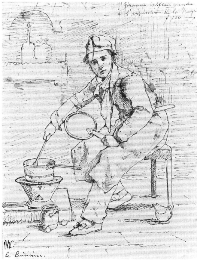
4 A. H. Bakker Korff, A Cook , Stedelijk Museum De Lakenhal, Leiden. Photo of the museum