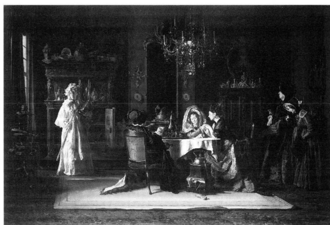
3 A. H. Bakker Korff, La fille du héros , Stedelijk Museum De Lakenhal, Leiden. Photo of the museum