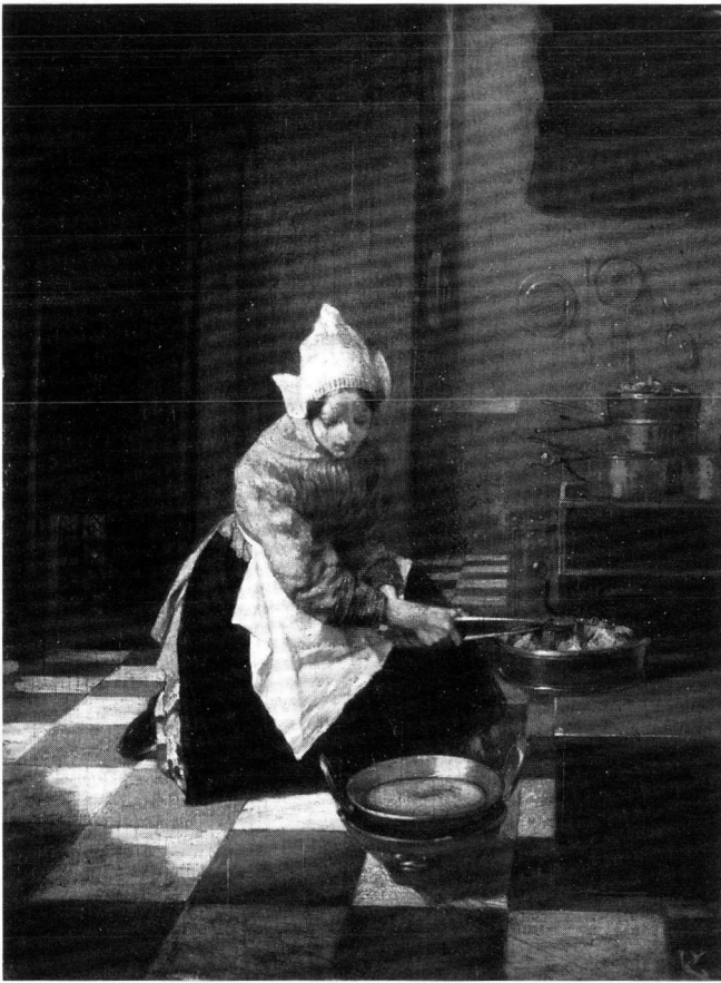
6 A. H. Bakker Korff, The Tart-baker , Rijksmuseum, Amsterdam.