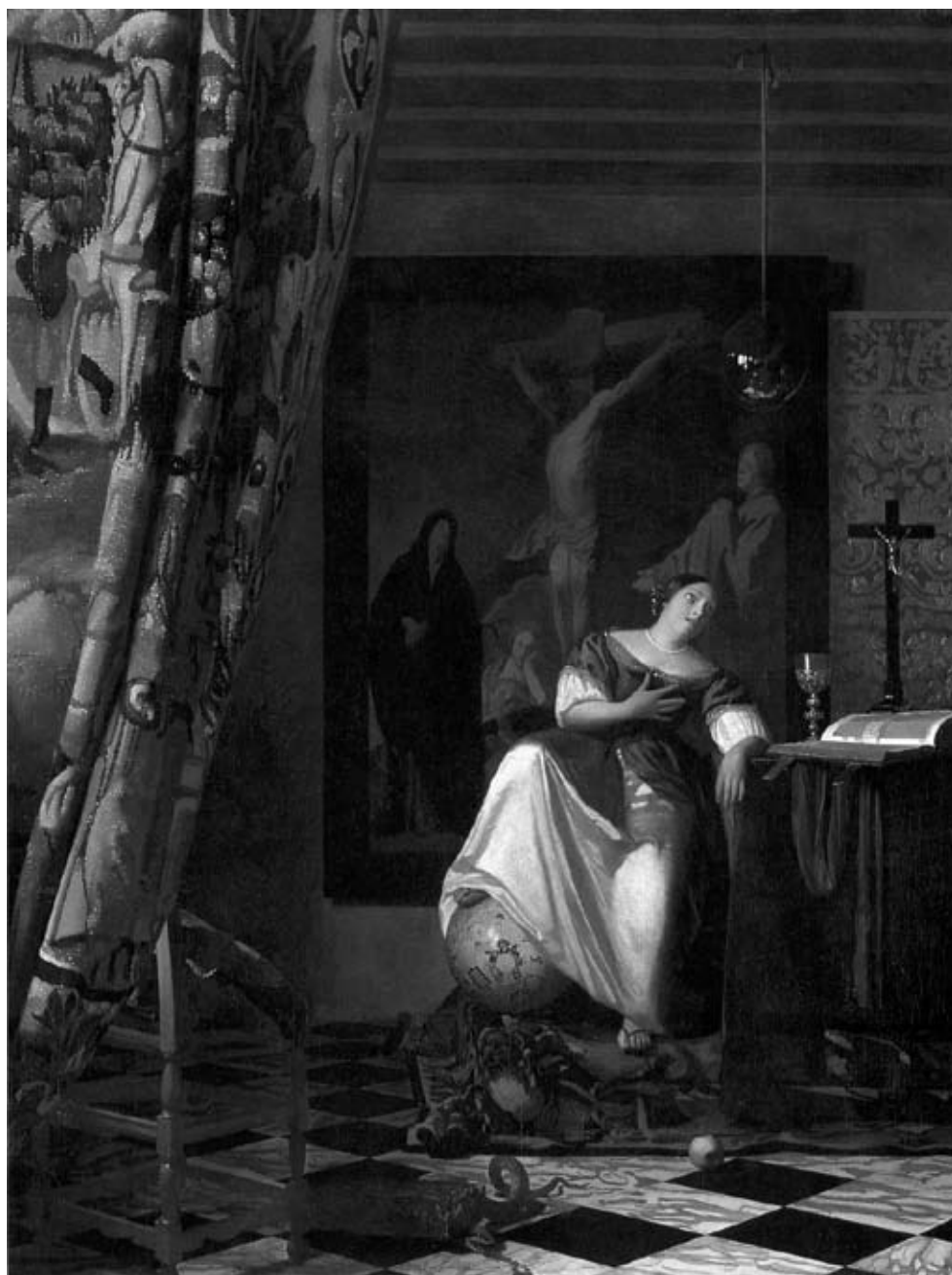
3 Johannes Vermeer, Allegorie op het geloof , ca. 1671-1674, doek, 113 x 88 cm. New York, Metropolitan Museum.