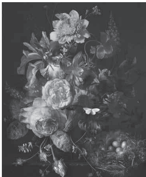
4. Jan van Huijsum, Bloemstillevens in een glazen vaas met een vogelnest op een stenen plint , doek, 41 x 34 cm, Verenigd Koninkrijk, particuliere collectie