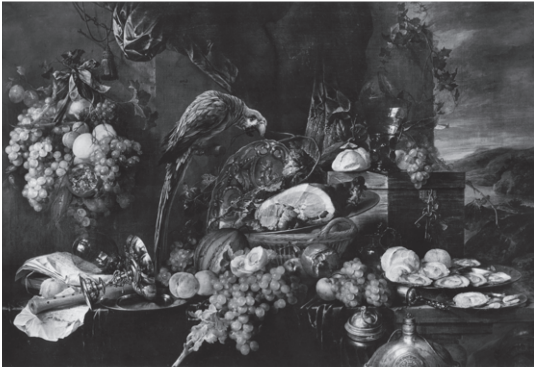
2. Jan Davidsz. de Heem, Pronkstilleven met papegaai , doek, 116 x 169 cm, Wenen, Akademie der bildenden Künste, inv.nr. 612