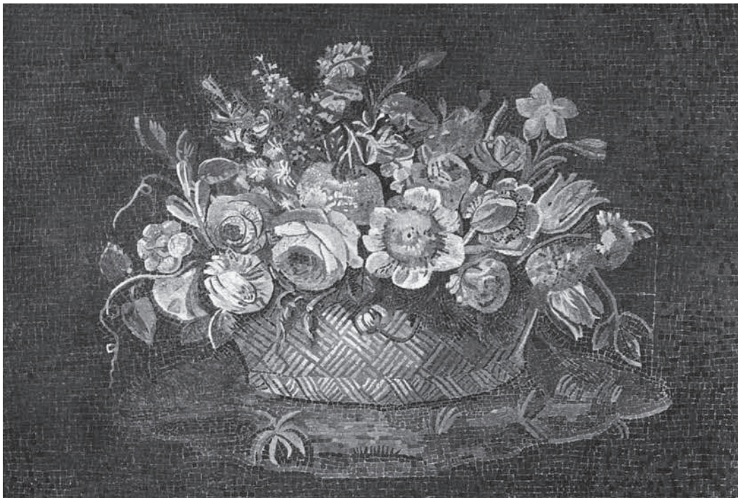
1. 18 de -eeuwse pastiche van een Romeins mozaïek Mand met bloemen , mozaïek, 67,5 x 104 cm, Rome, Vaticaanse Museum 1. Eighteenth-century pastiche of a Roman mosaic, Basket with flowers, mosaic, 67.5 x 104 cm, Rome, Vatican Museum

As a case in point he cited a mosaic of an 'early flower piece' supposedly from a Roman villa of the second century A.D, which is now in the Vatican Museum (fig.1). It was thought to be Hellenistic or an excellent Roman copy, and alleged to be one of the earliest representations of a fully-fledged flower still life. In any case, it was presented as such in several archaeological and art historical publications. 5 However, it turned out that flowers fashionable in the eighteenth-century were depicted in the mosaic, making it an eighteenth-century pastiche. This approach, he argued, would also allow nineteenth-century imitations of seventeenth-century masters to be exposed. On the other hand, paintings of flowers and plants have proven useful in determining when certain species were introduced