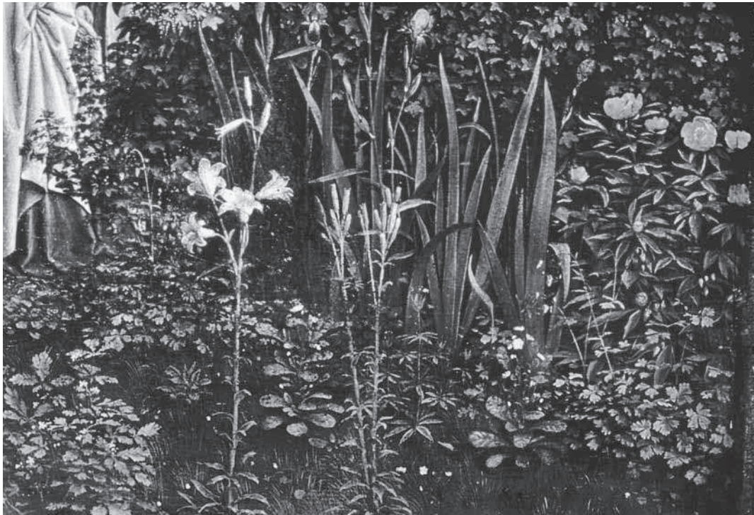
6. Detail uit: Jan en Hubert van Eyck, Het Lam Gods , polyptiek, ca. 375 x 260 cm, Gent, Sint-Baafskathedraal