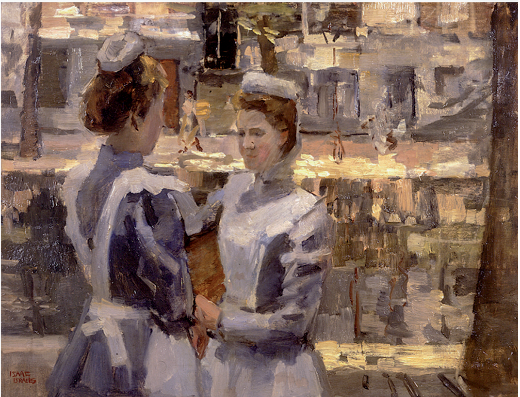
1. Isaac Israels, Twee dienstmeisjes op een Amsterdamse gracht , 1894, olieverf op doek, 60 x 80 cm, Groningen, Groninger Museum 1. Isaac Israels, Two maids on a canal in Amsterdam , 1894, oil on canvas, 60 x 80 cm, Groningen, Groninger Museum

From the mid-1920s, however, business began to decline. The Rotterdamsche Bankvereeniging [Rotterdam Bank Association; Robaver] forced Glerum to sell hundreds of works of art to pay off his debts. One of them was the watercolour Sleeping girl in white by Isaac Israels, which Glerum parted with in October 1922. 4 The Amsterdam art dealer Frans Buffa & Zonen was charged with offering the works privately or publicly. 5 Although the tide turned and Glerum resumed his collecting activities, at the end of the 1920s he once again had to sell off part of his collection to stave off bankruptcy. The first public sale was held at Frederik Muller's in Amsterdam on 16 and 17 April 1929, with more than 150 works going under the hammer. 6 Glerum died on 9 September 1930 following a short illness. In 1932 the family decided to part with the lion's share of the collection, and subsequently four auctions were held at Mak van Waay in Amsterdam in 1933. 7 Only about 40 works remained in the possession of the family. 8