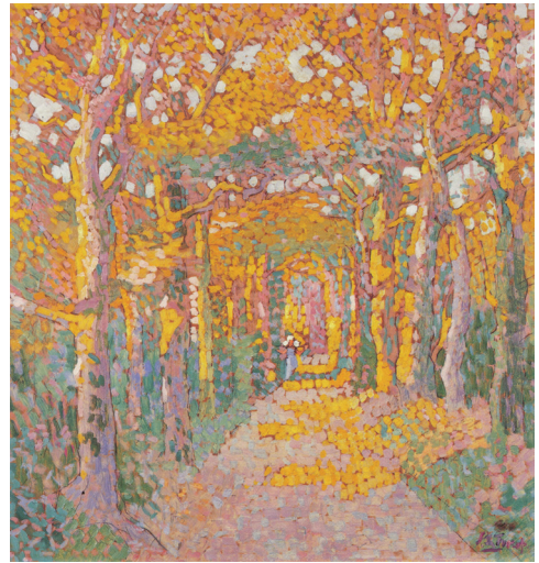
3. Jan Toorop, Laantje op Walcheren , ca. 1910, olieverf en potlood op karton, 61 x 57,5 cm, huidige verblijfplaats onbekend

Glerum kocht, weliswaar sporadisch, ook direct van de ezel in de ateliers van kunstenaars. 20 Opvallend hierbij is dat er verder weinig contact – laat staan vriendschappelijke banden – lijkt te zijn geweest tussen verzamelaar en de schilders van wie hij stukken aankocht. 21 Er was echter één uitzondering: Isaac Israëls. Niet alleen correspondeerden zij regelmatig, maar ook schilderde Israëls meerdere portretten van Glerum, zijn vrouw