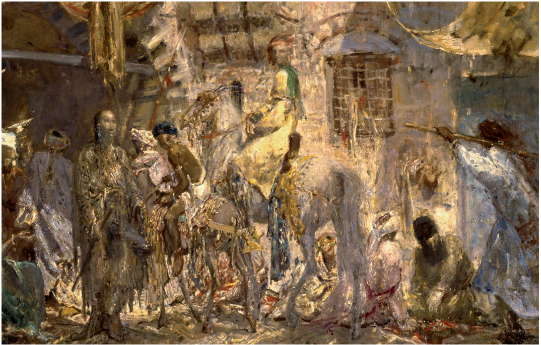
2. Marius Bauer, Oosters straatje , olieverf op doek, 76 x 135,8 cm, Den Haag, Gemeentemuseum