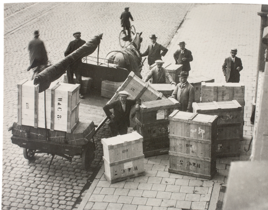
2. Anoniem, Het laden van kisten met schilderijen voor de bijna jaarlijkse reis naar Canada voor de deur van Van Wisselingh & Co, Rokin, Amsterdam, na 1911, 130 x 168 mm x 13 cm, Den Haag, RKD, Archief Eilers (0877), inv.nr. 176