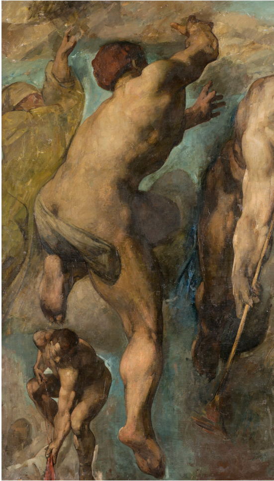
4. Nicolaas van der Waay, Het Laatste Oordeel , 1884, olieverf op doek, 181 x 107 cm, Rijswijk, Rijksdienst voor het Cultureel Erfgoed, inv.nr. R784.