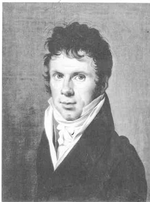
M. Van dael (J. F. van Dael)

daar na een aanvankelijk moeilijke beginperiode een glanzende carrière gemaakt. Behendig door de moeilijke revolutionaire tijd van de Terreur laverend, kon hij de machthebbers van zowel de vroege republiek, het Directoire, het Consulaat en keizerrijk, alsmede van het gerestaureerde koninkrijk en tenslotte van de Julimonarchie onder zijn klanten rekenen. Geen Salon in Parijs ging voorbij zonder dat hij in het middelpunt schitterde. De eerbewijzen die hem ten deel vielen, zijn ook talloos. Hij had zowel een atelier in het Louvre als in de Sorbonne, maar zijn woonadres in Parijs, zoals op het omslag van onze brief te lezen valt als ook op de titelpagina van de veilingcatalogus van 1840, was de 'cul de sac/impasse des feuillantines, n° 14, Rue Saint-Jacques, près le Val-de-Grâce', om de hoek van de Sorbonne. In zijn tijd werd deze straat in het Vième Arrondissement , beginnend aan de rue Saint Jacques halverwege afgesloten door het klooster van de zusters Feuillantines. Dit klooster werd tussen 1813 en 1850 stukje bij beetje afgebroken, omdat de doodlopende weg een verzamelplek was geworden van slecht volk, zwerfvuil en ongedierte. Zo ontstond de doorlopende rue des Feuillantines.