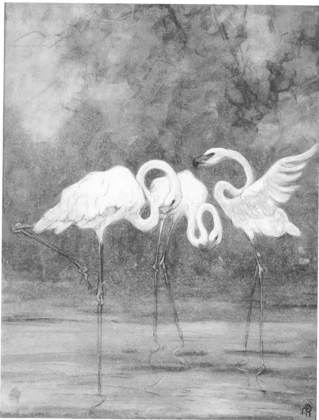
1. A. Sprokkelhorst, Flamingo's , pastel op strokarton, ca. 55,5 x 45 cm, particuliere collectie

Het werk was rechtsonder in de hoek gesigneerd, maar de signatuur was nauwelijks te ontcijferen. Een ding was duidelijk: er stond niet de naam van Piet